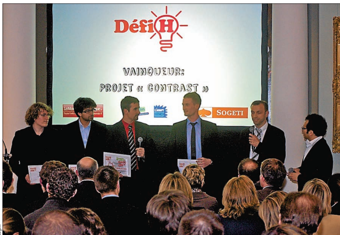
Le concours couronnera un projet et en primera d'autres, notamment celui de la « meilleure innovation technique ».

➤ Wink & Talk. Outil de communication pour personnes atteintes du LIS, souvent capables de ne bouger que les paupières ou les doigts. ■