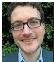
ADB for ever

Qu'est-ce qui a changé depuis que la conférence des grandes écoles a signé la charte en 2008 ?