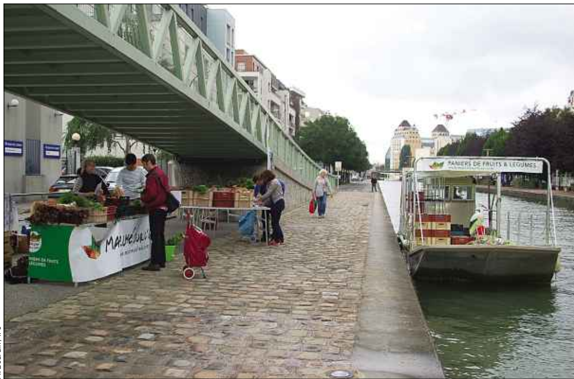
La barge fait escale à Pantin pour distribuer les paniers de fruits et légumes les mardis soirs et jeudis.

« On savait que le bateau ne serait pas rentable avec des volumes faibles et qu'il fallait donc monter en volume.