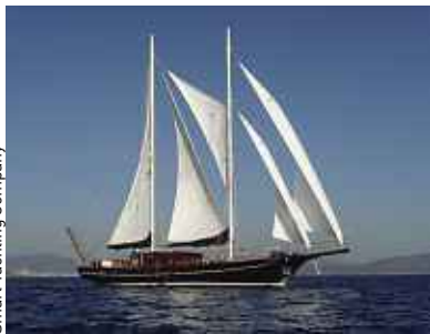
Smart Yachting Company

Bons plans bling-bling entre riches vacanciers P.8