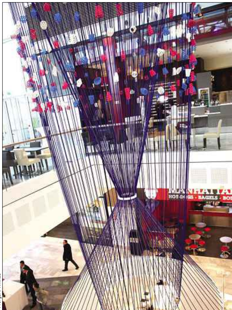
P. Verger / Wiithaa

Un lustre de 7 mètres fait entièrement de matériaux recyclables.