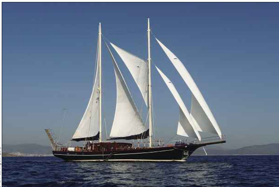
Smart Yachting Company

Comptez 2000 euros par jour pour louer ce voilier privé en Méditerranée.