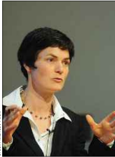
Ellen MacArthur à Londres, en 2012.