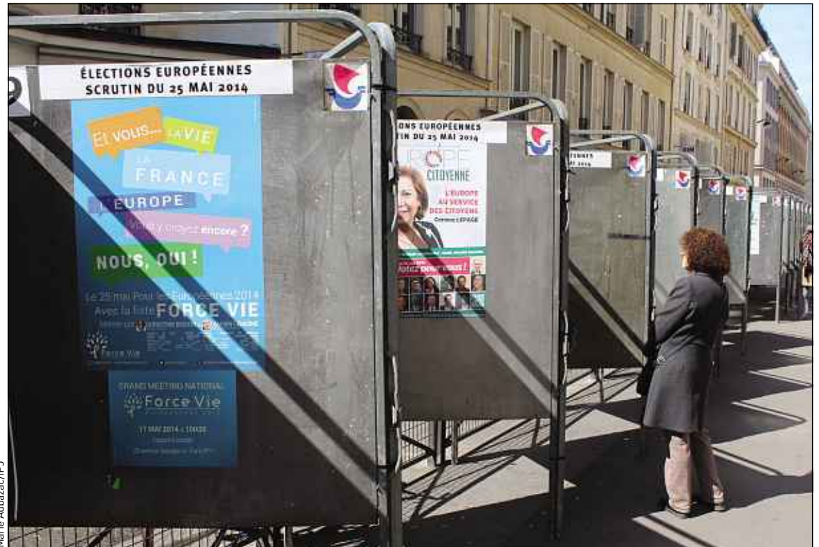
En Ile-de-France, seulement 16 des 31 listes prévoient des mesures pour l'ESS.

» Front National: rien sur l'économie sociale et solidaire. « Oui à la France, non à Bruxelles », le slogan du Front National est clair, le parti ne veut pas de l'Europe. Par ailleurs, le projet du FN ne comporte aucune proposition concernant l'ESS, qui ne fait pas partie des priorités de l'organisation.