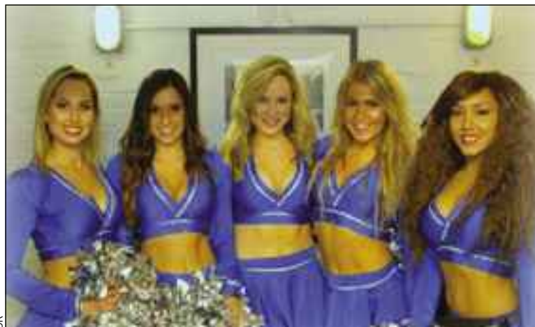
Les Londons Cheerleaders animeront le tournoi de rugby à 7 de Centrale.