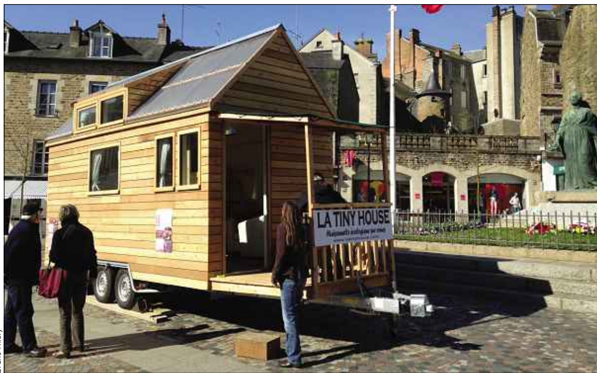
Les habitants de Fougères ont pu admirer une Tiny House présentée par une candidate aux dernières municipales.

La Tiny House, ou micro-maison, fait 10 ou 11 m 2 au sol et peut aller jusqu'à 20 m 2 avec une mezzanine. Le concept s'est développé aux Etats-Unis après l'ouragan Katrina. Il se développe en France depuis un an. En fonction des constructeurs, une micro-maison coûte entre 18 000 et 35 000 €. C'est un petit logement écologique, placé sur remorque et déplaçable à souhait. «Ce