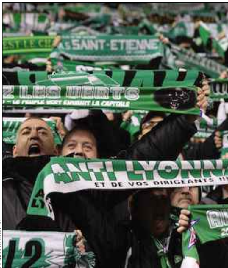
Les supporters stéphanois pourraient devenir actionnaires du club.

Ces initiatives sont encouragées par Jean Glavany, député PS et, auteur d'un rapport en faveur d'un « modèle populaire et durable du football français ». Selon lui, l'absence de « socios » dans l'Hexagone est lié au refus des propriétaires de club. « Ils ne veulent pas partager le pouvoir. » ■