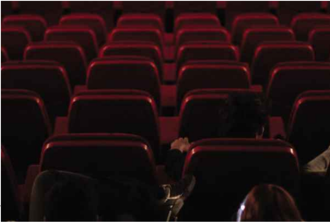
L. Hidalgo / Flickr

Le cinéma à la demande est présenté pour la première fois au festival de Cannes au sein du pavillon Next.