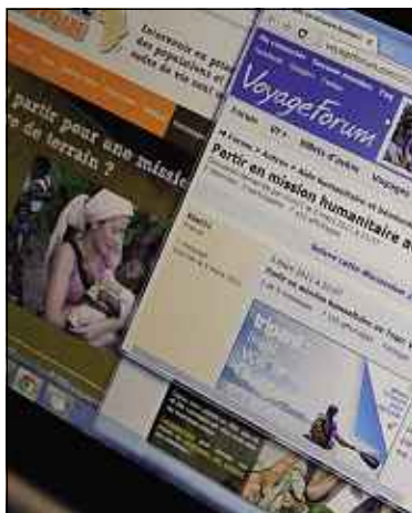
Les sites de bénévolat international se multiplient.