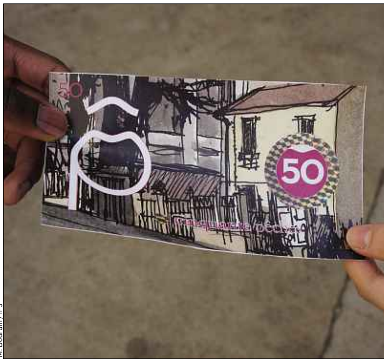
Les billets de Pêches définitifs devraient être imprimés d'ici un mois.

Les habitants du 10 e arrondissement de Paris sont, eux aussi, loin de pouvoir payer en Faubourgs. Ce projet de monnaie locale a été lancé en mai 2013 par le centre social et culturel Le Paris des Faubourgs. « C'est encore très