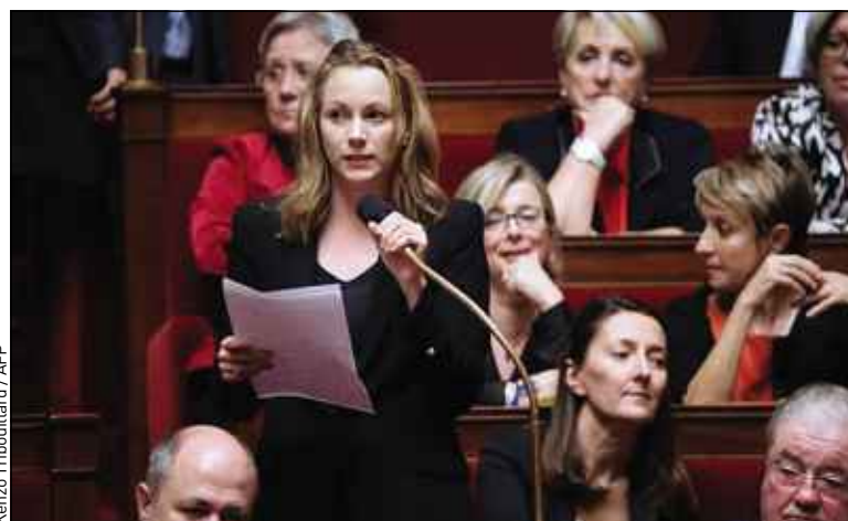
Jeudi, à l'Assemblée, Axelle Lemaire remplaçait Valérie Fourneyron.