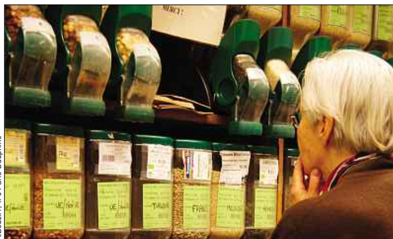
Le service de fruits et légumes secs se fait à l'aide de sacs en papier kraft.

Les supermarchés bio Biocoop ont pris le parti, depuis 25 ans, de proposer des rayons d'aliments solides en vrac. Depuis le mois de mars, ils essaient d'étendre ce concept aux produits liquides. Le magasin à Villeneuve-d'Ascq teste la vente d'huile, de vinaigre ou de vin, dans des bouteilles vides à remplir soi-même. « Les clients sont de plus en plus réceptifs, à tel point que nos stocks ont parfois du mal à suivre », affirme Dimitri Broders, le chargé de communication du magasin. Un modèle prometteur, même si des incertitudes demeurent : en Angleterre, une épicerie sans emballage a dû fermer, faute de rentabilité suffisante. ■