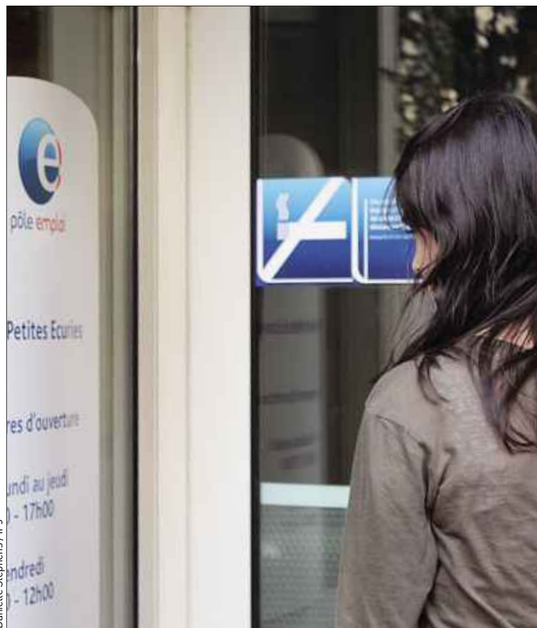
En dix ans, le nombre d'emplois dans l'ESS a augmenté de 23 %.

En 2013, un rapport du Centre de recherche pour l'étude et l'observation des conditions de vie évaluait à 114 000 le nombre d'embauches potentielles par an de jeunes peu ou pas qualifiés, dans le secteur de l'ESS. Et pour ceux qui souhaiteraient s'orienter après le baccalauréat vers ces métiers, un nouveau diplôme vient de voir le jour : le BTS « Conseiller en économie sociale et familiale ». ■