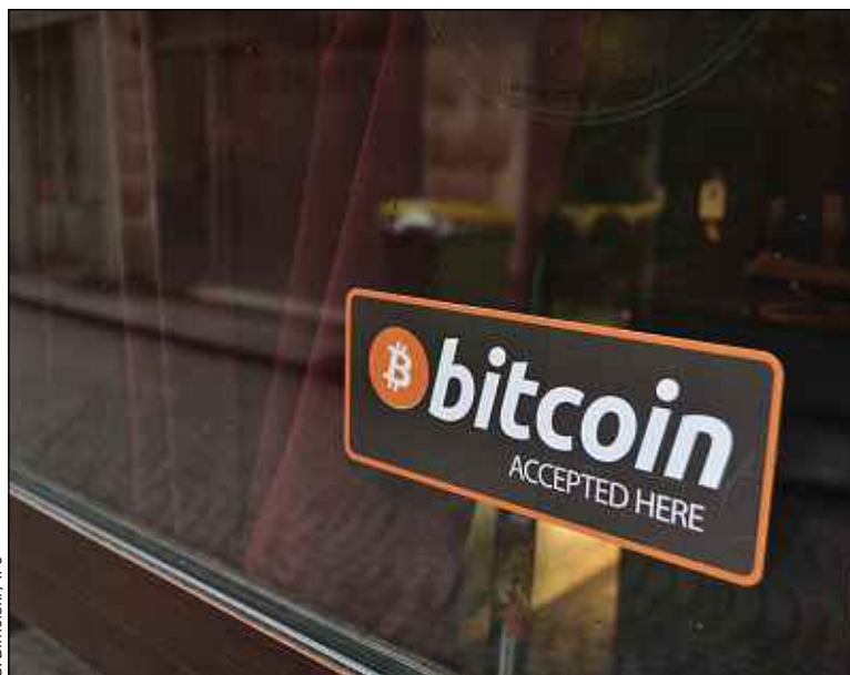
Plusieurs commerçants parisiens acceptent la monnaie virtuelle.

Au moment de la comptabilité, la facilité prime. «C'est comme une transaction normale, on a juste une colonne bitcoins à côté des colonnes carte bleue ou espèces», précise Sofiane. Quant au nombre de clients qui paient en bitcoins, il n'est pas énorme mais