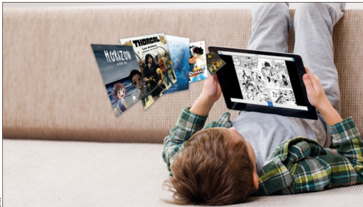
Le marché de la BD numérique représente 1,5% du chiffre d'affaires global de la bande dessinée en France.

« Le marché de la BD numérique représente 1,5% du chiffre d'affaires global de la bande dessinée en France, contre plus de 50% au Japon et 9% aux Etats-Unis », détaille Luc Boursier, PDG d'Izneo, n° 1 du secteur en Europe, créé par plusieurs grands éditeurs en