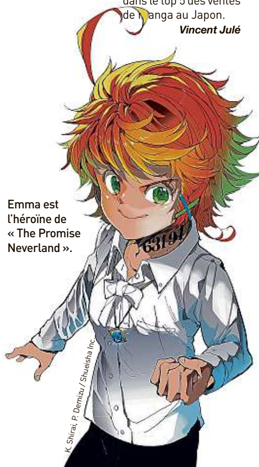
Emma est l'héroïne de « The Promise Neverland ».