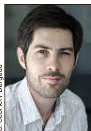
C. Gabriel / Dargaud

J'utilise un logiciel de dessin vectoriel qui me permet de modeler mon « trait » et mes couleurs comme du papier découpé. Chaque partie de mon image est donc mobile. Je peux ainsi composer au mieux mon image. Et je peux revenir à tout moment en arrière, ce qui permet d'ajuster mon histoire jusqu'à la toute fin de l'album.