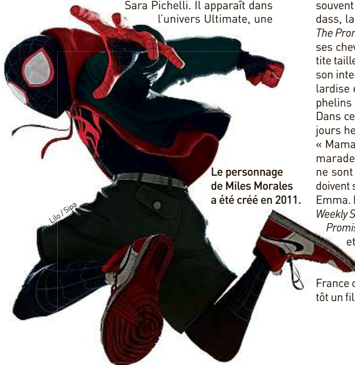
Le personnage de Miles Morales a été créé en 2011.