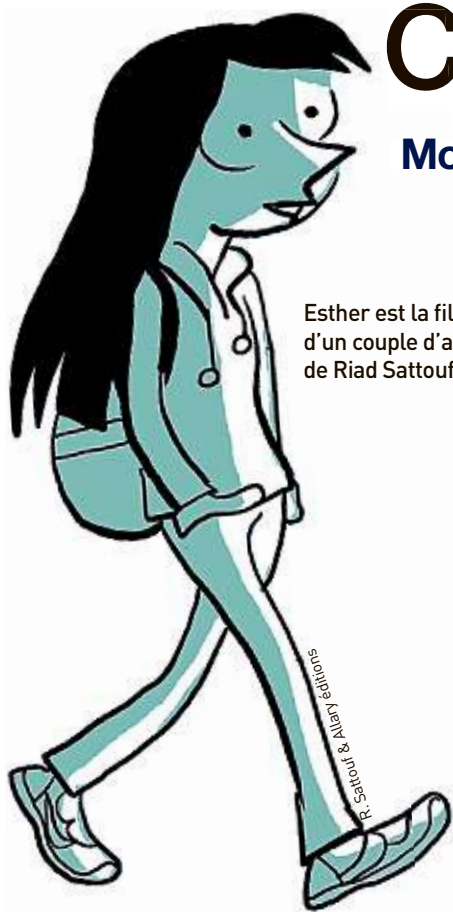
Esther est la fille d'un couple d'amis de Riad Sattouf.

Modèles Si les « vieilles » têtes d'affiche sont toujours là, de nouveaux héros et héroïnes ont pointé le bout de leur cartable, costume ou museau, et font vivre les BD, comics et mangas