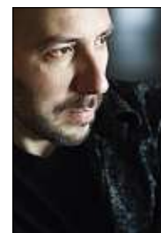
R. Scaglia / Dargaud

Le rapport à l'objet, son charme, sa matière, sa réalité liée au temps de séchage et à ses caractéristiques propres. Et, surtout, le fait d'être incarné. Le dessin qui en résulte existe et peut être manipulé. Pour finir, on sait quand il est achevé. L'objet impose son équilibre.